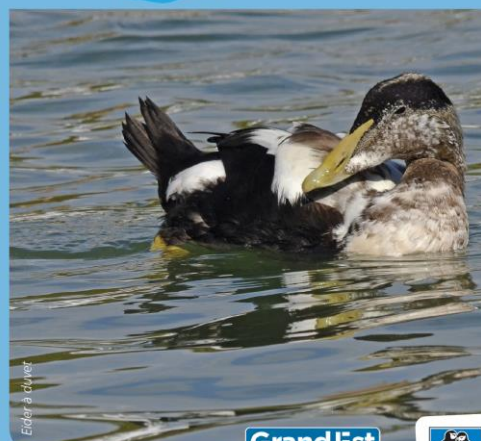
Eider à évier